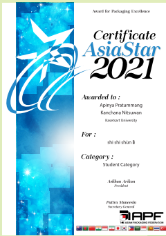
น.ส.กาญจนา นิตสุวรรณ และ น.ส.อภิญญา ประทุมมิม