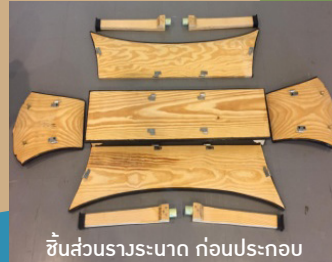
ชิ้นส่วนระนาด ก่อนประกอบ