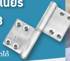
บุทบานพับสวมดอได้